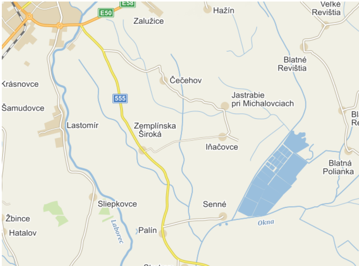
Obrázok 1 Mapa polohy obce

Nadmorská výška : Obec sa rozprestiera v nadmorskej výške 108 m. n. m.